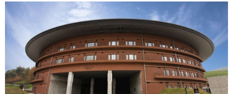
展示ホール (ホワイエ)

E-mail: 5gcmea@jemea.org (支払い関係を担当するJEMEA事務局 ( office@jemea.org )にも転送されます。)