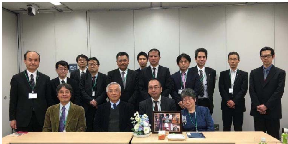
図2 第4回電磁波エネルギー応用セミナー